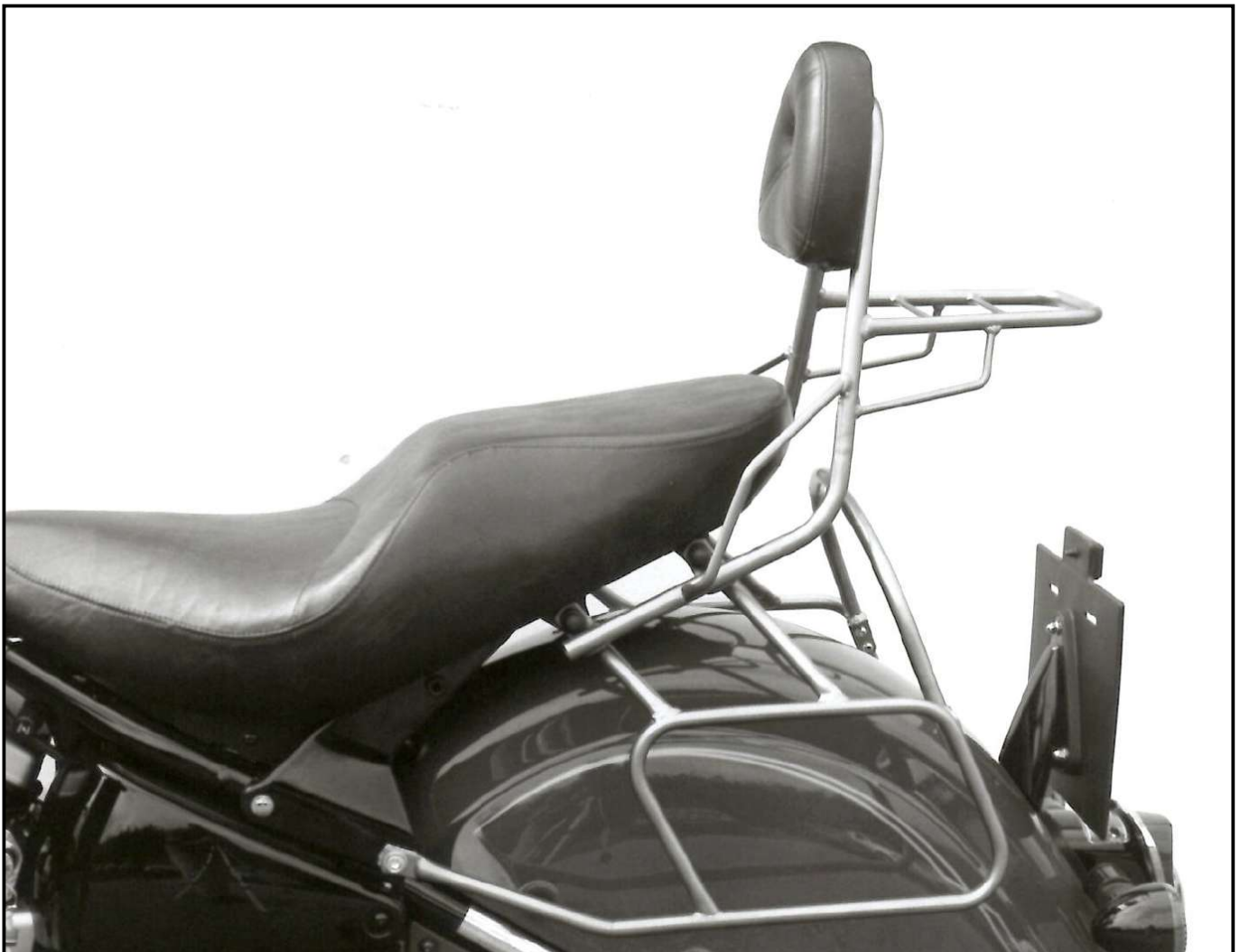
Foto zeigt Sissybar mit Gepäckbrücke in Kombination mit Satteltaschenhalter Picture shows the Sissybar with rear rack in combination with a leather bag holder.

4x Self lock nuts M10x1,25 4x Plastic caps M10