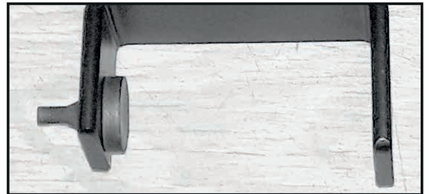
Abb.1 / Pic.1

Stick the rubber plug through the hole on the left side from the inside. Remove the original screw from the frame (see pic 3), it will be reused.