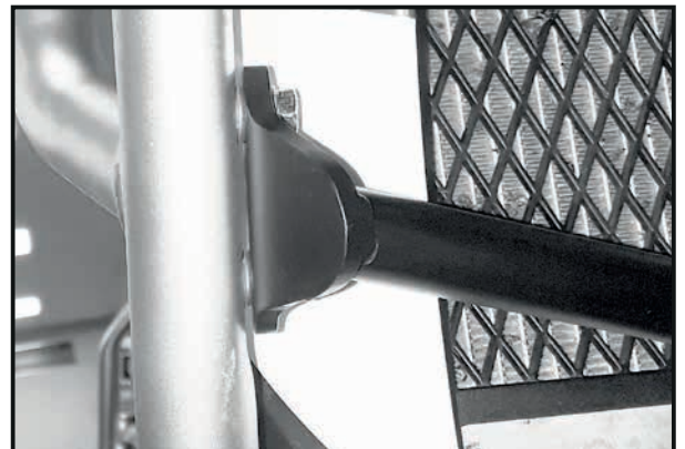
Abb.2 / Pic.2

In the direction of travel on the right with the original screw in the now free thread.